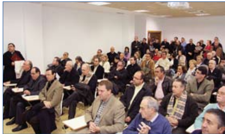
Numerosas personas asistieron a la inauguración.

Fue una jornada de convivencia, oración y formación en la que se reflexionó sobre los porqués de este anuncio y sus características.