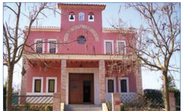
Fachada principal del templo parroquial de Santa Eulalia.

Tras la Eucaristía se presentó el nuevo disco de villancicos grabado por el coro de la parroquia.