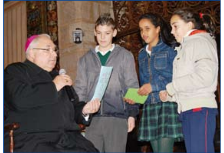
El Arzobispo recibe la felicitación navideña de algunos chavales.

Por otro lado, el grupo de formación de Animadores Mi-