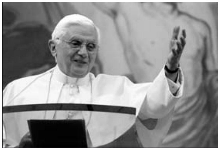
Benedicto XVI ha centrado su mensaje en los cristianos perseguidos.

"Son formas que fomentan a menudo el odio y el prejuicio, y no coinciden con una visión serena y equilibrada del pluralismo y la laicidad de las instituciones, además del riesgo para las nuevas gene-