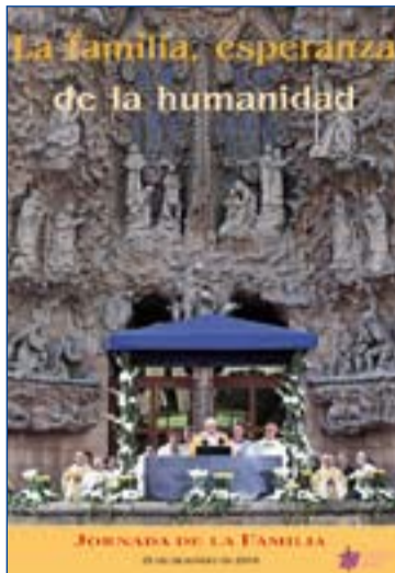
Cartel de la CEE para la Jornada.

Por último, la Subcomisión para la Familia y la Defensa de la Vida apuntan que "la familia cristiana es el signo y el recuerdo permanente para la Iglesia de que es esencialmente familia de hijos de Dios, llamada a