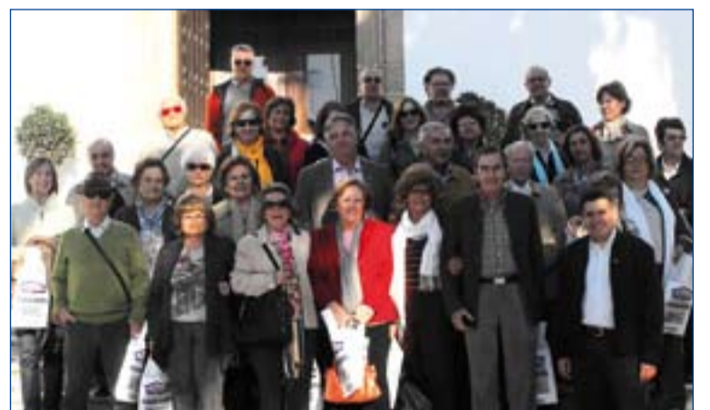
Peregrinos por la "Ruta de los Templarios".

Por otro lado, las parroquias de Llera, Maguilla y Valencia de las Torres han peregrinado a Santiago para ganar el Jubi-