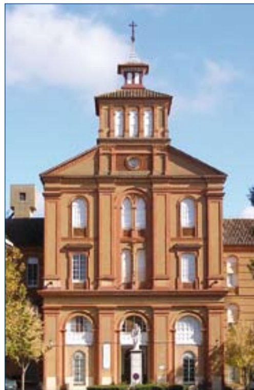
Fachada del colegio Jesuita de Villafranca.

En el ámbito del colegio se encuentra una mezquita, levantada en los años de la guerra civil española para los marroquíes que ocupaban el hospital instalado en dicho lugar. Se trata de una muestra de la arquitectura islámica de nuestro si-