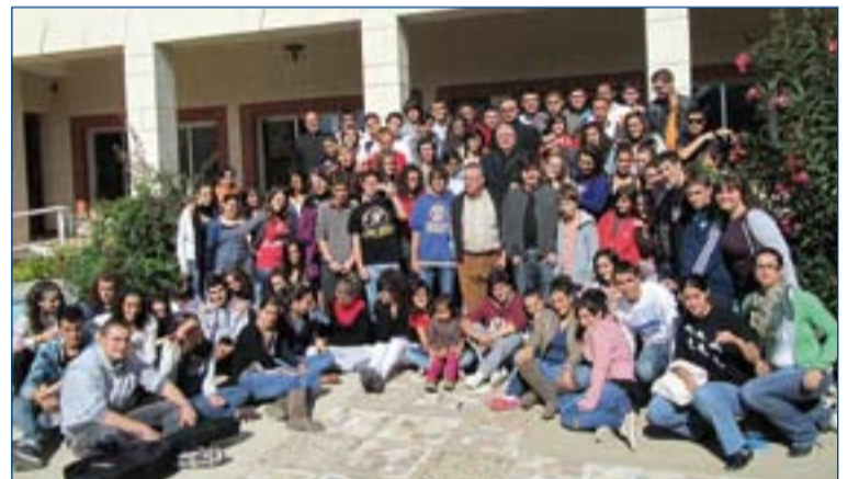
El Arzobispo y los participantes en la Asamblea.

Los militantes estuvieron acompañados por un grupo de animadores y consiliarios, que a su vez, también han programado el curso atendiendo a su formación y para compartir la tarea de animación de los estudiantes cristianos extremeños.