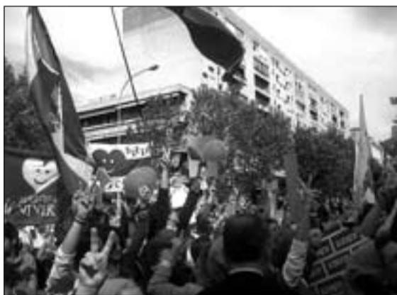
Miles de personas participaron en la manifestación provida.

Miles de personas salieron a las calles de Sevilla, el pasado sábado, para protestar por la industria creada en torno al aborto y las instituciones públicas que lo promueven. La concentración fue frente al hotel Meliá Sevilla , que acogía el encuentro de propietarios de clínicas abortistas y "profesionales" que practican abortos, patrocinado por el Ayuntamiento de la ciudad y la Junta de Andalucía. Durante más de una hora mostraron así su condena ante la celebración de encuentros que, disfrazados de "congreso científico", solo persiguen incrementar el negocio del aborto.