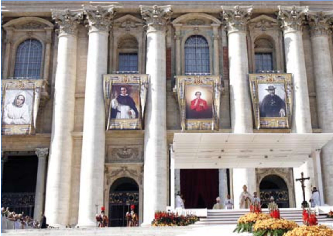
La Iglesia no sólo recuerda a los canonizados en la Solemnidad de Todos los Santos.

■ El 1 de noviembre la Iglesia Católica se dedica especialmente a rezar a los santos para pedir su intercesión. La primera noticia que se tiene del culto a los mártires es en el año 156.