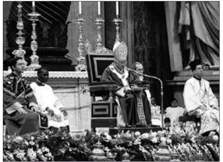
Benedicto XVI pronuncia la homilía de la Eucaristía de clausura.

Benedicto XVI también tuvo palabras en favor de la paz durante su homilía. Para el Papa, "desde hace demasiado tiempo, en Oriente Medio perduran los conflictos, las guerras, la violencia, el terrorismo. La