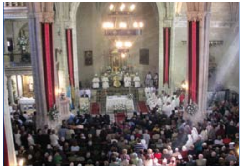
Eucaristía de clausura del Año Jubilar Berzocaniego.

La diócesis de Plasencia ha celebrado la clausura del Año Jubilar Berzocaniego en la parroquia de Berzocana, donde se encuentran las reliquias de sus Patronos, san Fulgencio y santa Florentina.