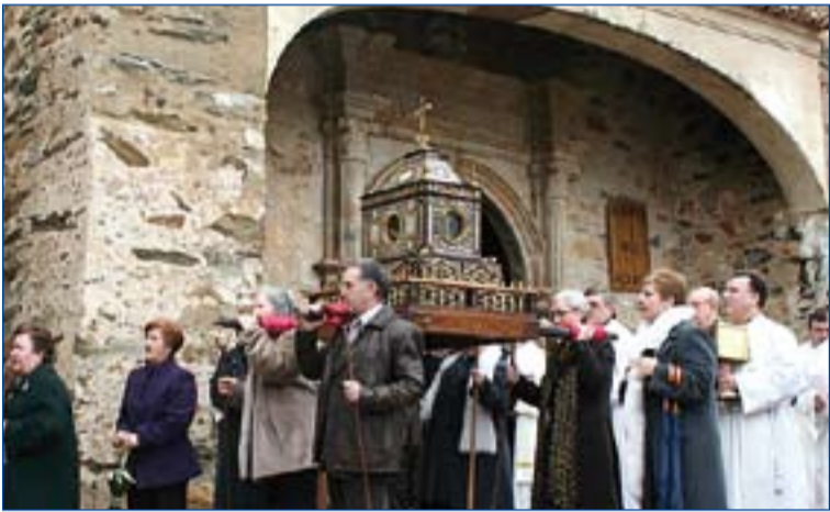
Procesión de las reliquias de san Fulgencio y santa Florentina.

Este Año Jubilar fue concedido por el Papa con motivo del 400 aniversario de la traslación de las reliquias de estos Santos al mausoleo-relicario que el pueblo de Berzocana levantó para ellos.