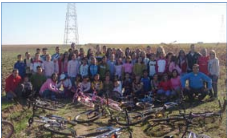
Jóvenes de la parroquia de La Albuera.

Por otro lado, 40 jóvenes de Fuente del Maestre, pertenecientes a grupos, han participado en una convivencia en el colegio salesiano de Puebla de la Calzada. Durante el fin de semana han reflexionado sobre la acción de Dios en sus vidas y han profundizando en la necesidad de ser testigos en sus ambientes. Además, los jóvenes escucharon los testimonios de militantes de la JEC, movimiento que se les presentó durante esta convivencia.