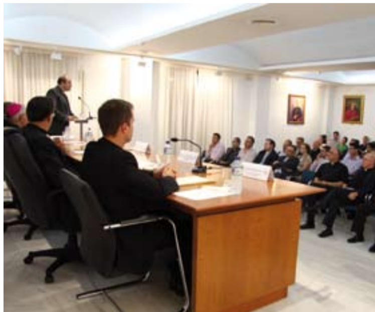
Acto de inauguración del curso académico en el Arzobispado de Badajoz.